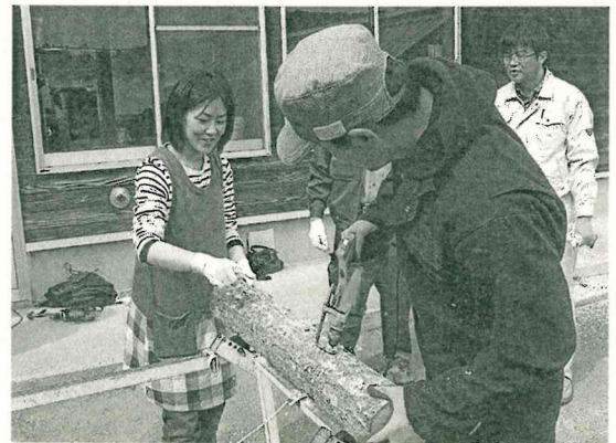
しいたけの植菌の様子

研修を受けた方々から、「内容が面白い。今後も参加したい。」「初めてしいたけ栽培を行うところだが、植菌の体験が出来て良かった。」などの感想がありました。